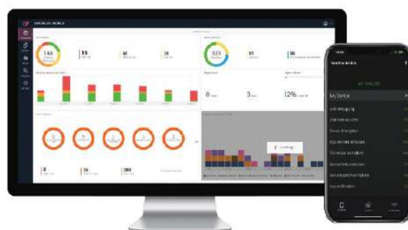
Consola de administración de Harmony Mobile